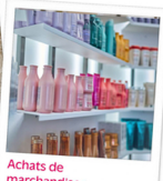
Achats de marchandises