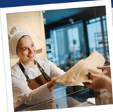
Ventes de biens