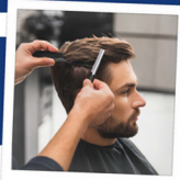
Ventes de services