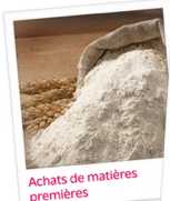
Achats de matières premières