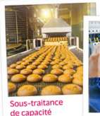
Sous-traitance de capacité