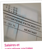
Salaires et cotisations sociales