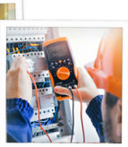
Sous-traitance de spécialité