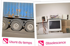
Usure du temps