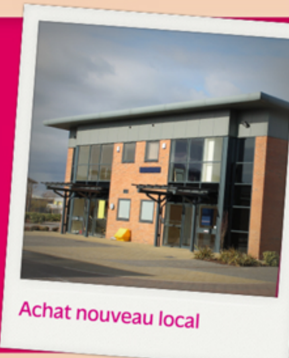
Achat nouveau local