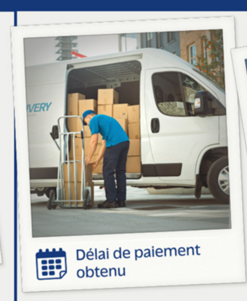
Délai de paiement obtenu