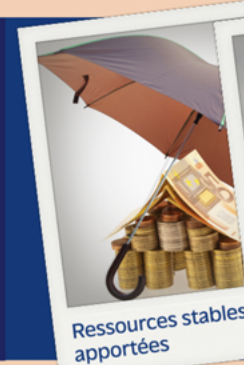
Ressources stables apportées

CAPITAUX PROPRES DETTES FINANCIÈRES LONG TERME