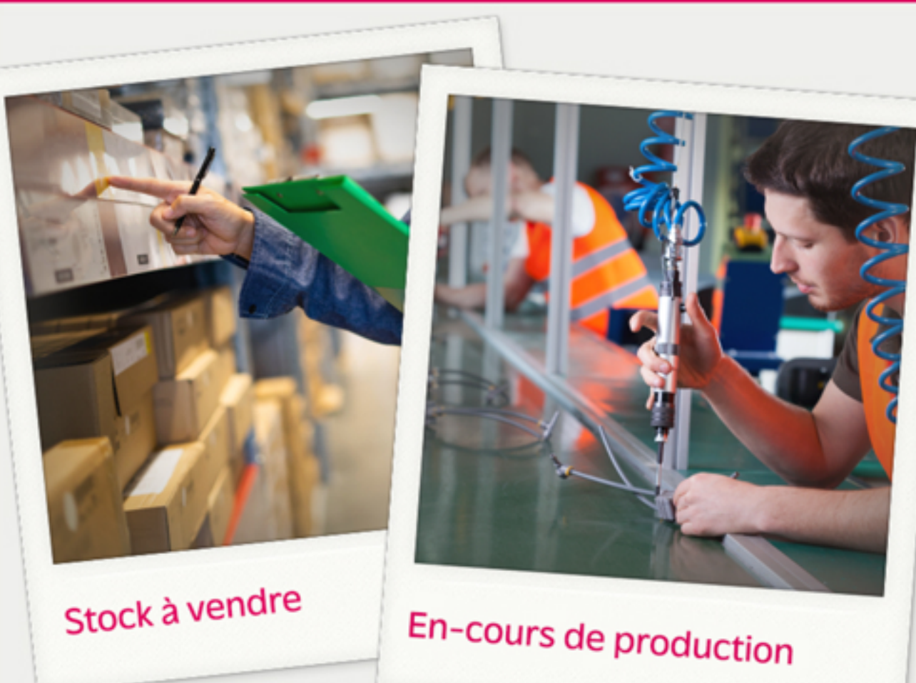
Stock à vendre