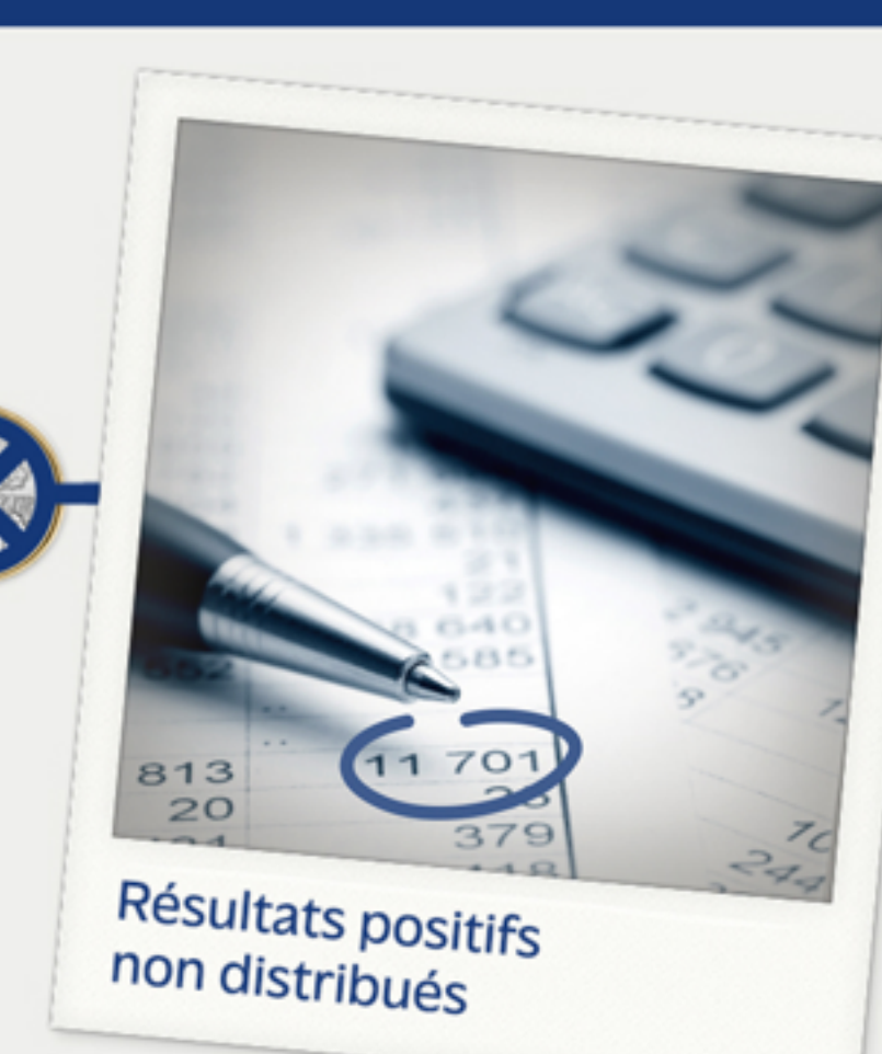
Résultats positifs non distribués