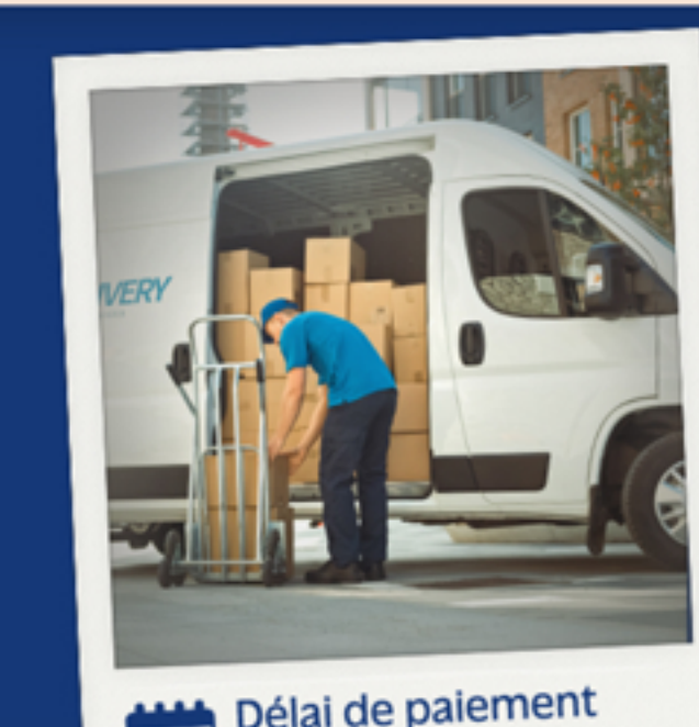
Délai de paiement obtenu

Pour plus d'informations rendez-vous sur : www.mesquestionsdentrepreneur.fr