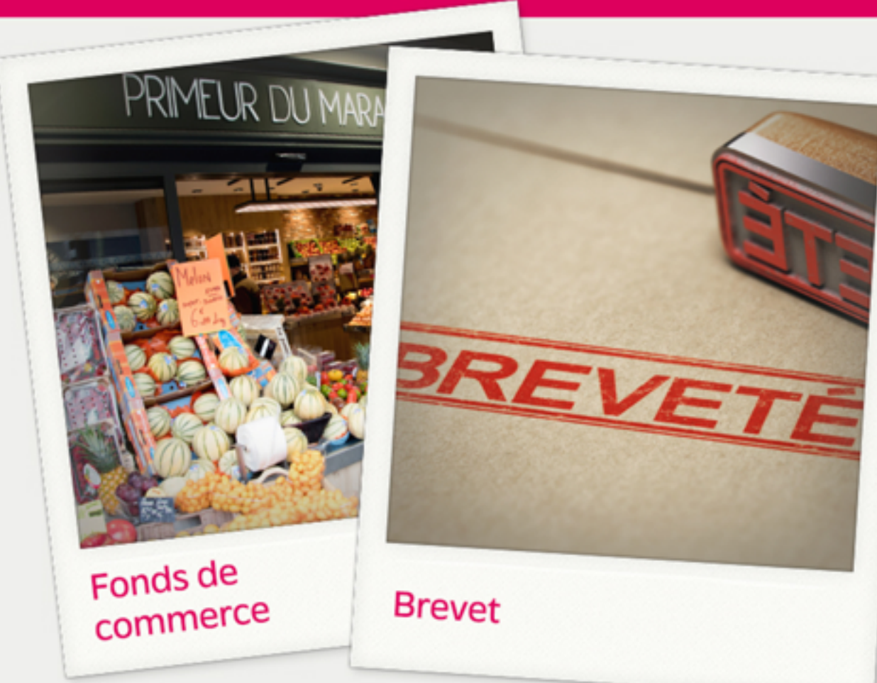
Fonds de commerce