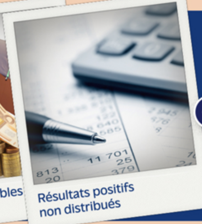
Résultats positifs non distribués