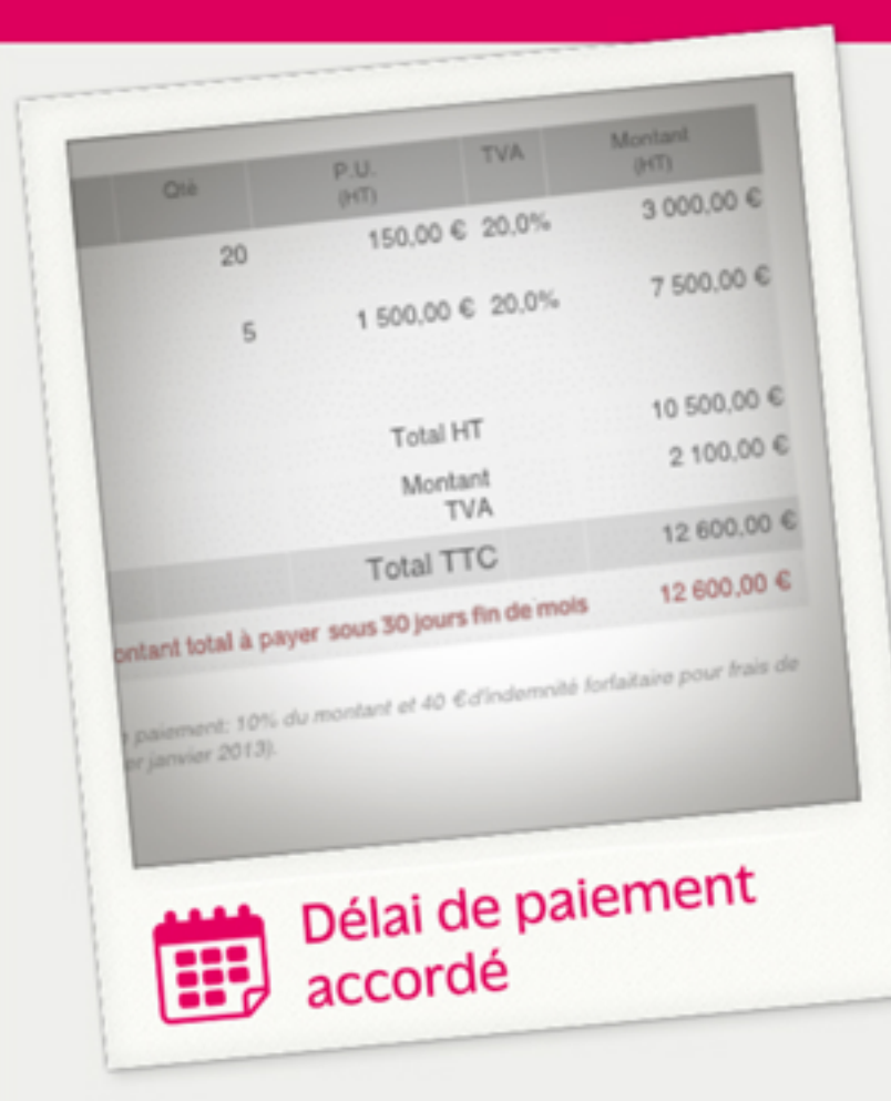
Délai de paiement accordé