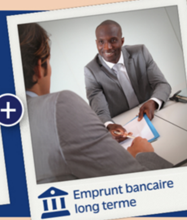
Emprunt bancaire long terme