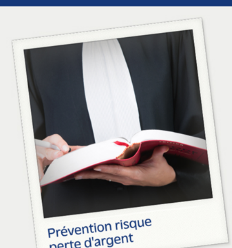
Prévention risque perte d'argent