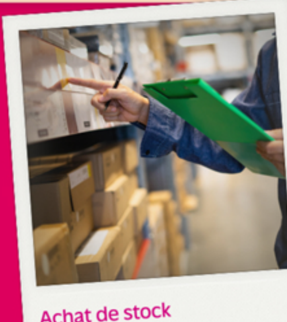
Achat de stock